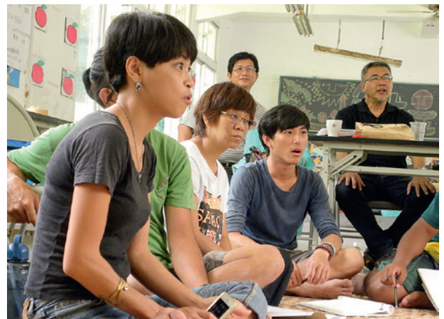
Intensive Diskussion auf Chinesisch und Englisch

Es folgt eine intensive und aussergewöhnliche Arbeitswoche. Wir kommunizieren in englischer und chinesischer Sprache. Die Übersetzung braucht Zeit, ist aber gleichzeitig eine hilfreiche Verlangsamung. Ein Kinderbuch hat bisher noch niemand illustriert, die meisten möchten das aber gerne versuchen. Viele möchten gerne gleich loslegen und mit ihren Materialien arbeiten, doch ich habe zuerst noch etwas Anderes vor. Ich möchte klären, was ein gutes Kinderbuch ist. Ich möchte aufzeigen, wie vielfältig die Möglichkeiten in der Gestaltung sind und wie mit einfachen Mitteln Bücher von Hand hergestellt werden können. Ich möchte die Sinne schärfen, für das, was wir als Qualität empfinden. Dazu habe ich eine Sammlung von Kinderbüchern aus der ganzen Welt mitgebracht, die ergänzt wird mit Büchern aus Taiwan. Wir arbeiten und diskutieren intensiv, die Durchmischung der Gruppe ist anregend, gerade bei der Frage um die authentische Darstellung kultureller Identität. Mit jeder Stunde verdichtet sich die Atmosphäre, alle Erkenntnisse werden auf grossen Papierbögen in Englisch und Chinesisch festgehalten und als eine Art Kompendium an den Wänden aufgehängt.