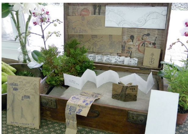
Ein Koffer voller Buchskizzen

Der Abschied am Ende der Woche fällt allen etwas schwer. Die Woche war bewegend, die Atmosphäre war nicht nur freundschaftlich und offen, sondern zunehmend enthusiastisch, die Abgeschiedenheit des Bergdorfs ermöglichte einen vertieften Prozess. Es sind sich alle einig: in dieser Woche ist in Liqiu etwas Elementares geschehen. Über diesen Workshop einer Schweizerin, die im Bergdorf mit indigenen Künstlerinnen und Künstlern Kinderbücher erarbeitet, wurde mittlerweile schon in lokalen und nationalen Zeitungen berichtet.