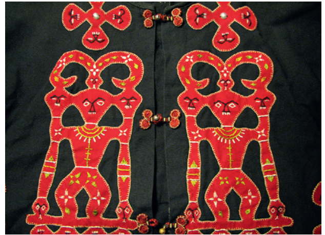
Eine traditionelle Jacke mit dem Emblem einer Paiwanfamilie

ihre Eltern oder Grosseltern bitten, ihnen eine traditionelle Geschichte zu erzählen. Denn Sheng-Hua hat während dieser Woche eine Idee entwickelt. Er möchte eine Bibliothek in Liqiu einrichten.